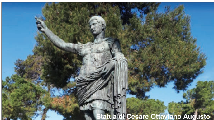
Statua di Cesare Ottaviano Augusto

dal 29/9 al 2/10 UNA CITTA' DA GUSTA@RE - ore 18.30 Centro Storico - L'ospitalità evoluta. Cibo, libri, ristorazione e tecnologia