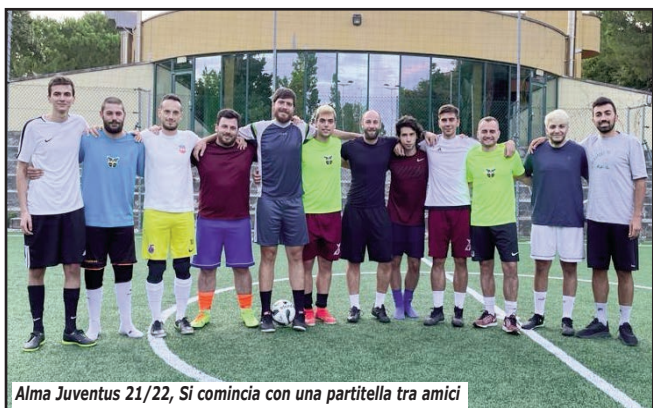
Alma Juventus 21/22, Si comincia con una partitella tra amici