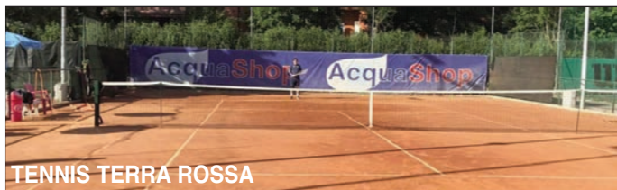
TENNIS TERRA ROSSA