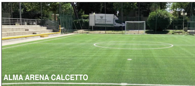
ALMA ARENA CALCETTO

Nuovo centro PADEL con 3 campi superpanoramici e PROSSIMA COPERTURA PER L'INVERNO