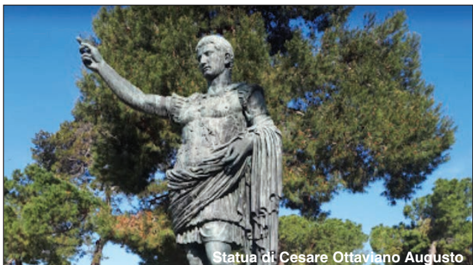
Statua di Cesare Ottaviano Augusto