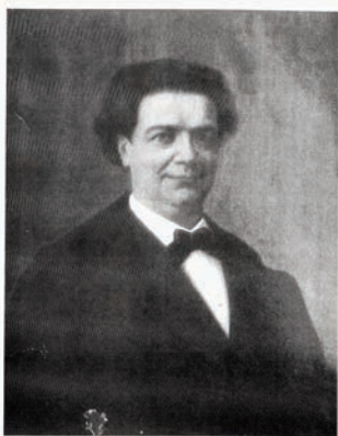
Ritratto ad olio di Cesare Tonini Bossi eseguito da Giovanni Pierpauli (Fano, proprietà privata)

la breve traversa, che potremmo definire 'El gugul di Via Fanella', è dedicata a Cesare Tonini Bossi (Fano, 1829-1880), il basso-cantante che debuttò nel Teatro Provvisorio di Fano nel 1853. Da quel momento in avanti fu rinomato interprete sui palcoscenici di molte importanti città europee, spesso accompagnato dalla moglie pianista, la fanese Maria Dini.