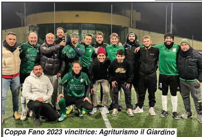
Coppa Fano 2023 vincitrice: Agriturismo il Giardino