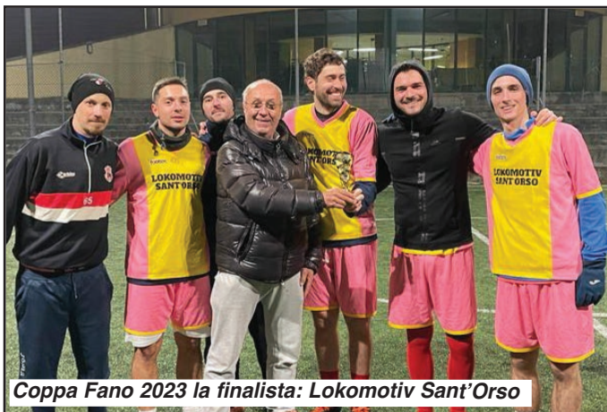
Coppa Fano 2023 la finalista: Lokomotiv Sant'Orso