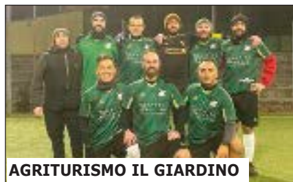
AGRITURISMO IL GIARDINO