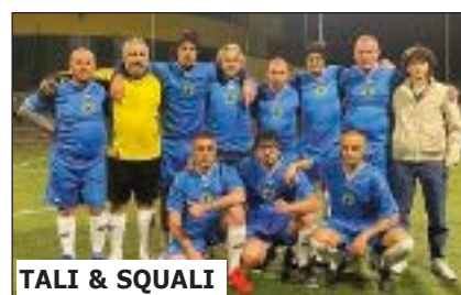
TALI &amp; SQUALI