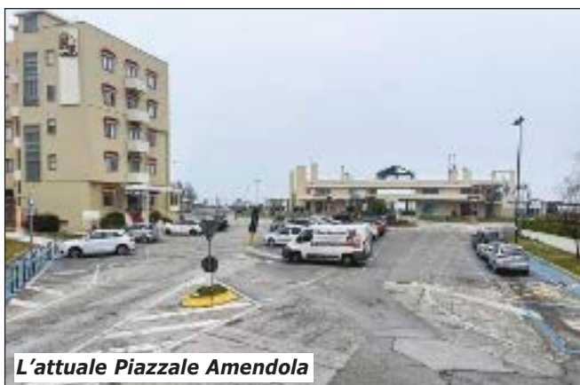
L'attuale Piazzale Amendola