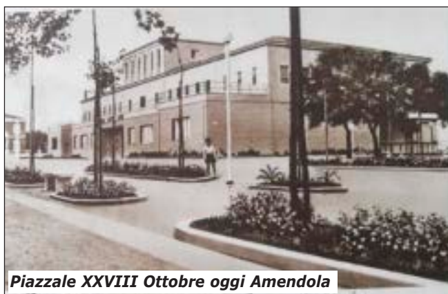
Piazzale XXVIII Ottobre oggi Amendola

Il piazzale fino all'aprile del 1923 era denominato semplicemente "dello Stabilimento Bagni" ma il Consiglio comunale dell'epoca volle intitolarlo a Benito Mussolini.