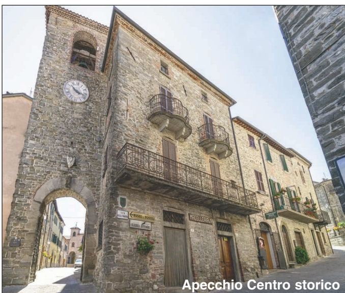
Apecchio Centro storico

Apecchio - Pesaro Urbino - Confcommercio Marche Nord Come tutti i punti di confine, Apecchio è stato ricettacolo di tradizioni e culture diverse, accolte e integrate in armonia, di cui meravigliose testimonianze artistiche e culturali, alcune delle quali da record, ci aspettano.