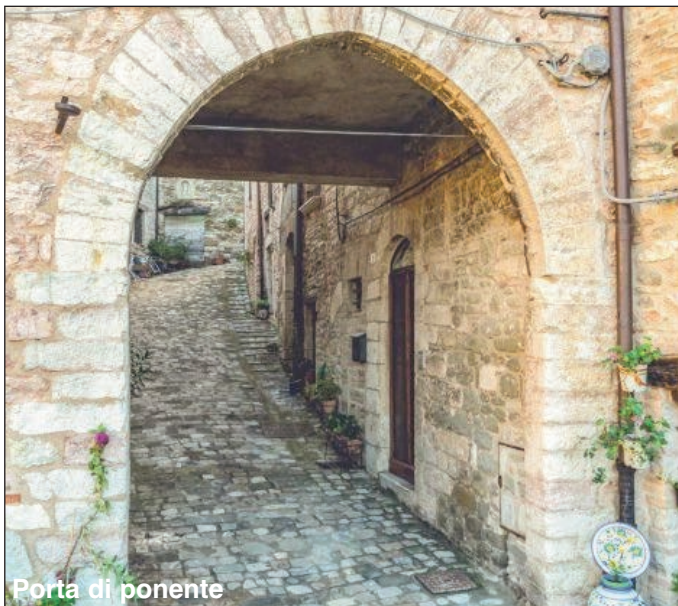
Porta di ponente

La storia dei "Piobici", tra natura e medioevo. Un borgo immerso in un'atmosfera fatata. Chi giunge per la prima volta a Piobbico, borgo racchiuso e adagiato in una vallata nel cuore dell'Appennino umbro-marchigiano, crederà di ritrovarsi in un'atmosfera fiabesca: fiumi, torrenti, cascate, boschi e montagne rappresentano la cornice perfetta per rivivere le antiche favole che ancora si raccontano ai bambini.