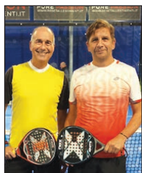
GOLD - Brasile Simoncelli Caimmi

All'Alma Park è partita a settembre, nella nuovissima struttura coperta e riscaldata, la stagione agonistica di Padel 2024/25, che vede scendere in campo 36 coppie, divise in tre gironi Silver, Gold e Master. Questo mese presentiamo le coppie del girone Gold, qui sotto insieme alle classifiche aggiornate alla fine del mese di settembre. In grigio il Silver in arancio il Gold e in rosso il Master. Nelle foto le coppie del campionato Gold nei primi nove posti del campionato.