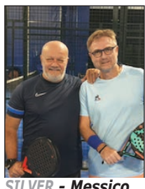
SILVER - Messico Barbieri Fronzi

All'Alma Park nella nuovissima struttura coperta e riscaldata continua la stagione agonistica di Padel 2024/25, con i tre campionati Silver, Gold e Master che vedono scendere in campo 36 coppie. In testa al Silver troviamo Perù, Slovenia e Turchia; nel Gold Korea, Norvegia e Giappone; Nel Master Bahamas, Kenia e Andorra. Questo mese presentiamo le coppie del girone Silver, qui sotto insieme alle classifiche aggiornate alla fine del mese di ottobre. In grigio il Silver in arancio il Gold e in rosso il Master.