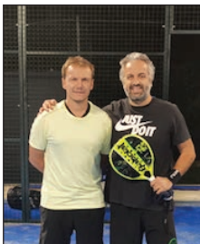
SILVER - Slovenia Paupini Lucentini