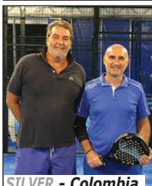
SILVER - Colombia Segato Ferri

All'Alma Park nella nuovissima struttura coperta e riscaldata continua la stagione agonistica di Padel 2024/25, con i tre campionati Silver, Gold e Master che vedono scendere in campo 36 coppie. In testa al Silver troviamo Perù, Slovenia e Turchia; nel Gold Korea, Norvegia e Giappone; Nel Master Bahamas, Kenia e Andorra. Questo mese presentiamo le coppie del girone Silver, qui sotto insieme alle classifiche aggiornate alla fine del mese di ottobre. In grigio il Silver in arancio il Gold e in rosso il Master.