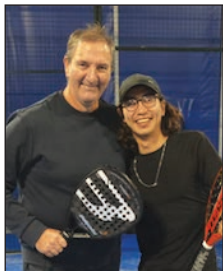
SILVER - Argentina Medei Manuel