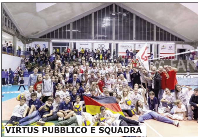
VIRTUS PUBBLICO E SQUADRA