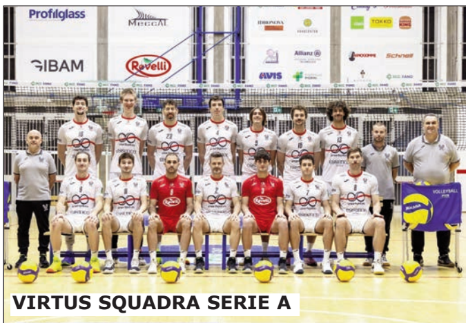
VIRTUS SQUADRA SERIE A