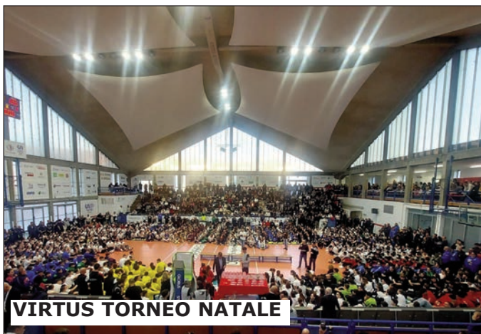
VIRTUS TORNEO NATALE