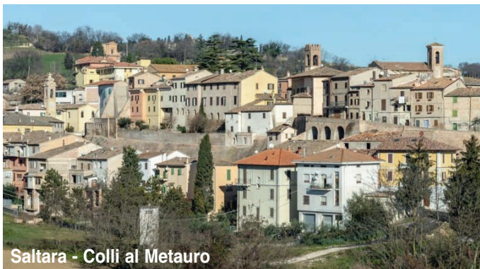
Saltara - Colli al Metauro

Tra la costa dell'Adriatico e le vette della Gola del Furlo si trova un microcosmo fatto di rocche e borghi murati, di palazzi e ville nobiliari, di monasteri e chiesette, di poggi argillosi, boschi selvaggi e campagne riccamente coltivate, che regalano eccellenze enogastronomiche.