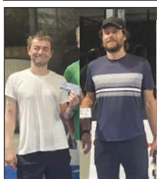
SILVER 2° - Slovenia Mengarelli Conti

A giugno dopo diversi mesi di intensi incontri e di gran divertimento si è concluso all'interno del Pala Padel dell'Alma Park, il secondo campionato cittadino di padel suddiviso in tre categorie Silver, Gold e Master.