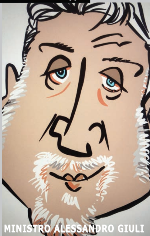
MINISTRO ALESSANDRO GIULI