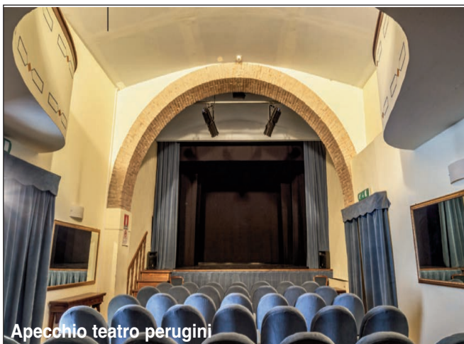
Apecchio teatro perugini

Un luogo unico, crocevia tra Marche, Umbria e Toscana, terre diverse che qui si incontrano in una sintesi stupenda, tutte riconoscibili dalla cima dell'altro grande guardiano della città, il Monte Nerone, dove la vista arriva ad abbracciare perfino il mare. Come tutti i punti di confine, Apecchio è stato ricettacolo di tradizioni