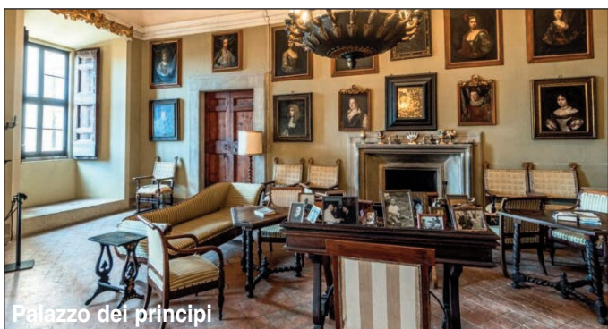
Palazzo dei principi

Immersa in boschi e foreste, inclusa la più vasta cerreta d'Europa, la località si