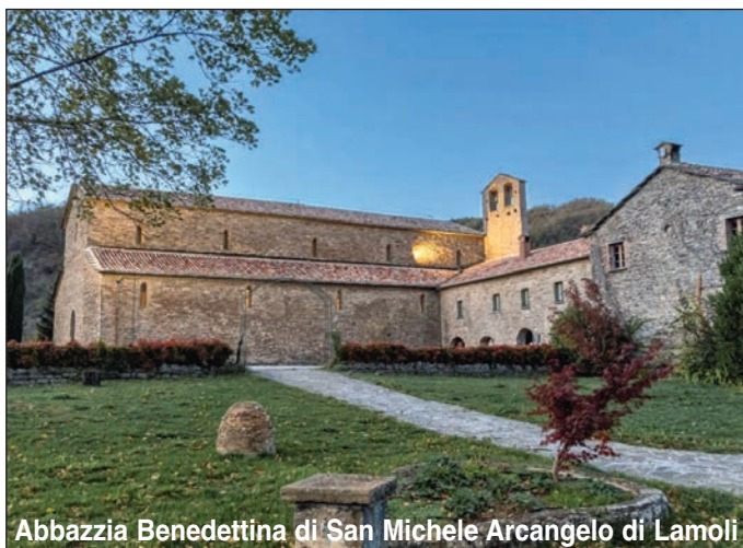
Abbazia Benedettina di San Michele Arcangelo di Lamoli

Meritevoli di visita all'interno di Parchiule sono la chiesa di "Santa Maria di Parchiule", eretta nel 1538, simbolo di una fede incrollabile e fulcro di una comunità resistente alle tempeste della storia, e la "Cappella dei Crociani", nota anche come "Oratorio della Madonna del Bell'Amore".