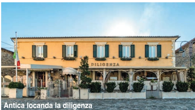
Antica locanda la diligenza

Borgo Pace, quindi, non è solo un luogo da molti definito fiabesco, è un borgo diffuso, è una sinfonia di quiete e bellezza, un viaggio nel tempo dove ogni pie-