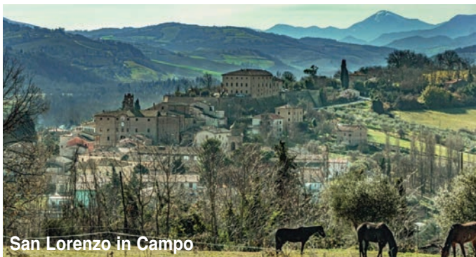
San Lorenzo in Campo

Arrivare a San Lorenzo in Campo significa trovarsi di fronte a una scenografia meravigliosa. Ad ogni passo l'emozione sale.