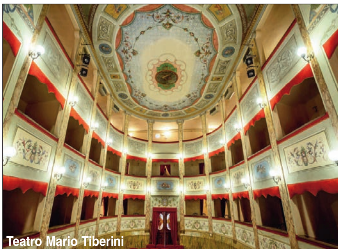
Teatro Mario Tiberini

Lo testimoniano i capitelli decorati con motivi vegetali, con figure di animali o di creature mitologiche. L'osservatore attento potrà scorgere l'antico fregio Romano incastonato sopra una colonna, raffigurante un'aquila e una conchiglia, mentre anche il più distratto noterà le quattro colonne diverse dalle altre per colore e materiale: la loro origine risale addirittura al regno egizio.