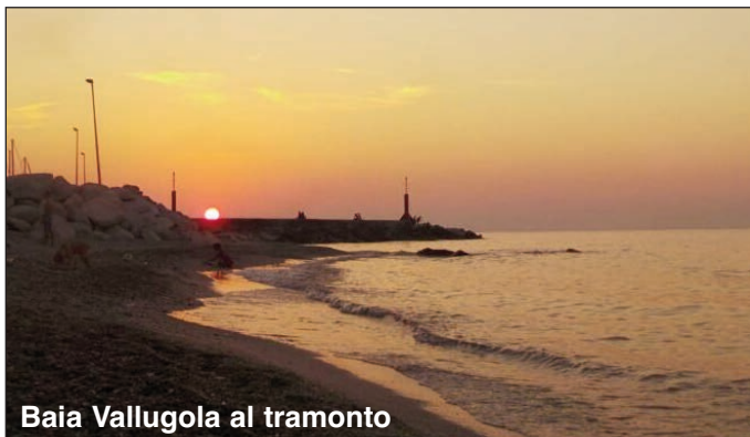
Baia Vallugola al tramonto

La spiaggia qui si sviluppa con un andamento peculiare, diverso dal resto della costa con cui confina. Essa infatti forma un'insenatura naturale dove oltre la spiaggia finissima come polvere d'oro si trova anche una parte di costa sassosa, come nella splendida Baia di Vallugola, in quella zona che i gabiccesi chiamano "sottomonte".